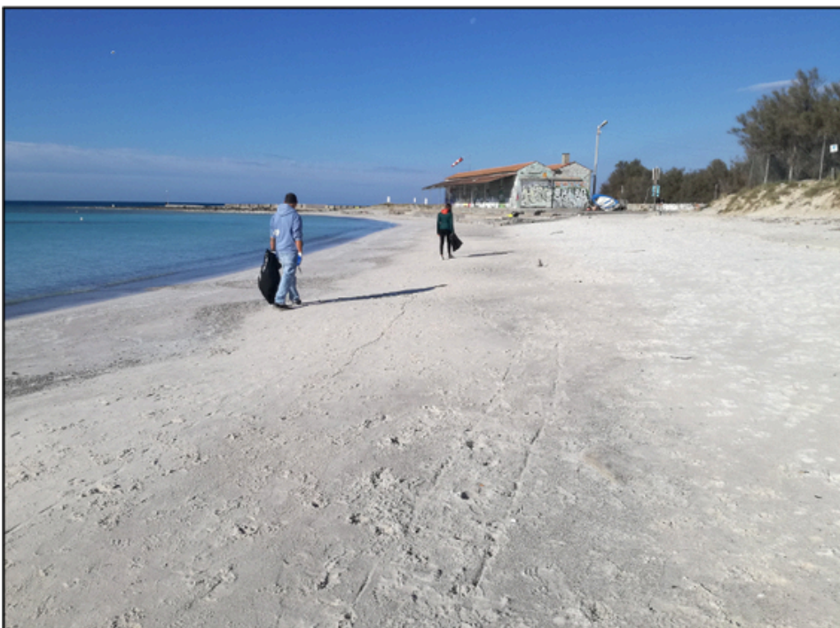
Lillatro (S3) nel Comune di Rosignano Marittimo.