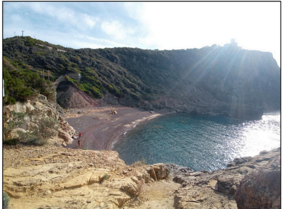
Cala del Leone (S2), nel Comune di Livorno.