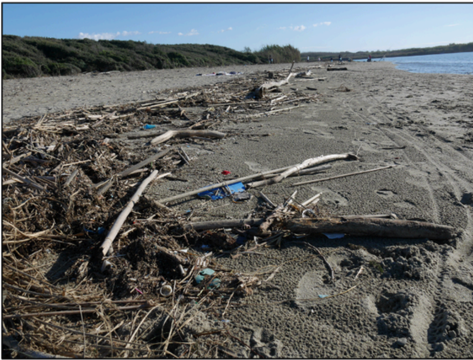
La spiaggia di Bocca di Serchio (S1), nel Comune di Marina di Vecchiano.